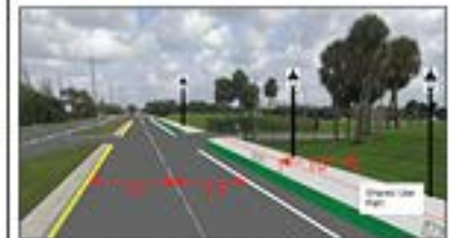
SA KI PWOPoze A