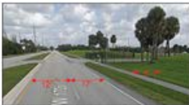
SA KI DEJA EGZISTE A

172nd Ave. soti nan Bass Creek Road pou rive nan Pembroke Road